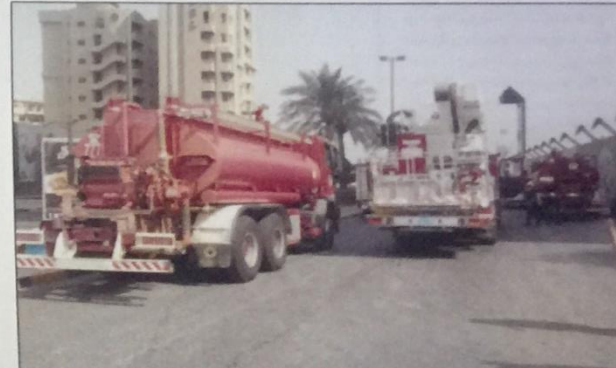
اليات الإطفاء، تحيط ببرج الحمرا