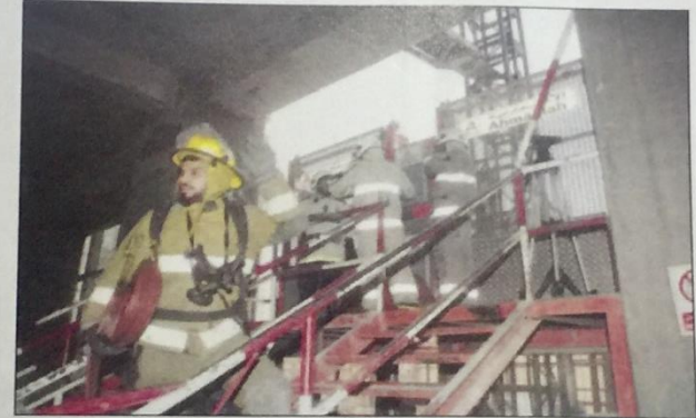
رجال الإطفاء في تدريبهم لإنقاذ العمال المحتجزين