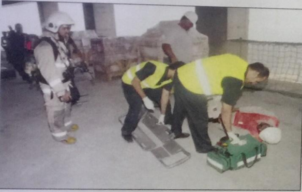
الطوارئ الطبية شاركت في التمرين